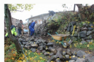
Apadrina el Camí de Naens

Microreserva Implica't en la conservació de La Tremoluga de Naens, un bosquet ple de vida on pots venir a reconnectar amb la natura i omplir-te d'energia